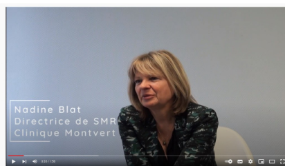
Témoignage terrain - Interview Clinique Montvert